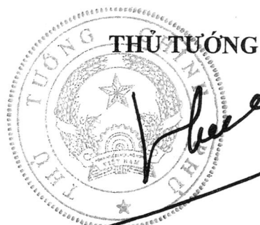
Nguyễn Xuân Phúc

Ủy ban nhân dân cấp tỉnh, cấp huyện đơn đốc, chỉ đạo, hướng dẫn việc tổ chức thực hiện hệ thống hóa văn bản của Ủy ban nhân dân cấp dưới theo quy định./.